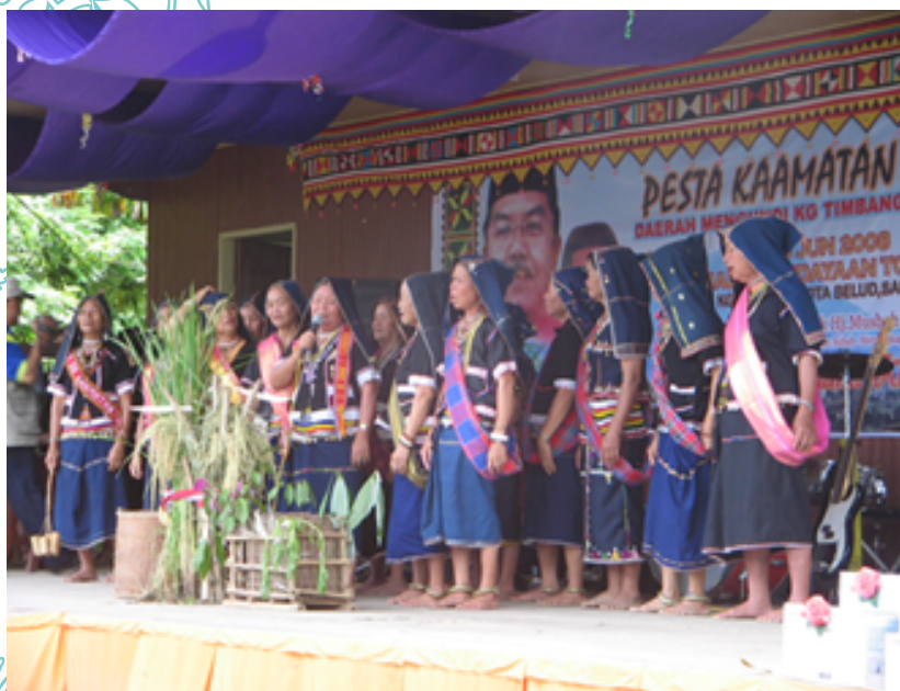
Para Bobolian etnik Tobilung sedang menjalankan upacara ritual Modsuut semasa perayaan Pesta Kaamatan

Upacara ritual Monogit diadakan apabila keadaan semasa memerlukan berkat daripada Tinumaru (Tuhan bagi kepercayaan etnik Tobilung) untuk menjauhkan alam dari sebarang bencana seperti musim kemarau yang berpanjangan agar tanam-tanaman dan sumber kehidupan manusia tidak terjejas. Mengikut kepercayaan orang-orang tua etnik Tobilung keadaan cuaca yang buruk adalah disebabkan oleh perbuatan negatif manusia sendiri yang melakukan perkara-perkara yang melangkaui batas-batas nilai sosial dan adat resam. Upacara ini dilaksanakan oleh seorang Bobolian yang biasanya diadakan di kawasan berhampiran sungai dan disertai oleh semua penduduk kampung.