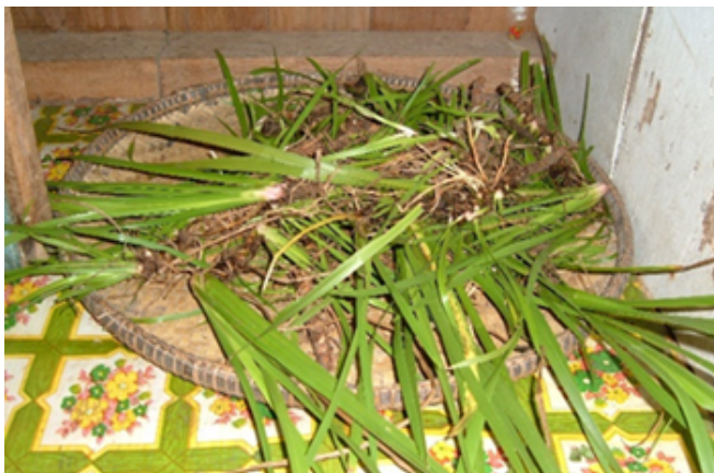
Pokok Komburongo (Jerangau)

Mereka yang memerlukan pertolongan daripada penunggu Komburongo perlu mengadakan upacara ritual Mogorunduk dan Modsongodou. Batang komburongo akan dikerat kemudian dikeringkan. Selepas itu keratan komburongo akan dicucuk menggunakan tangsi atau benang kemudian diikatkan pada sebatang kayu yang dipanggil Pidangau.