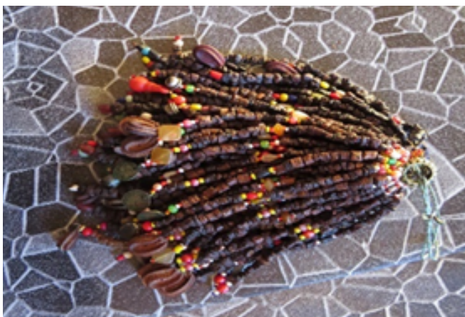
Komburongo yang telah diolah menjadi perantara bobolian dengan kuasa spritual semasa melakukan upacara ritual