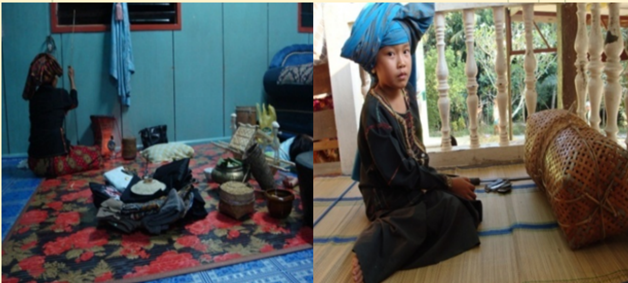
'Tolikud' (kanak-kanak) sedang menjaga anak ayam yang dimasukkan ke dalam bakul. 'Bobolian' menghulurkan rotan di jendela sambil 'Momurinait'.

Bobolian Koduaan merupakan sejenis ritual yang bertujuan untuk memohon kepada Dewato agar semua ahli keluarga memperoleh kesihatan yang baik tanpa sebarang gangguan daripada roh-roh jahat. Ritual ini akan diadakan selama dua malam oleh Bobolian dan dibantu oleh seorang kanak-kanak yang digelar Tolikud . Antara bahan-bahan yang digunakan dalam upacara ini ialah podou (perahu), beras bersama jeruk ikan, padi dan gong.