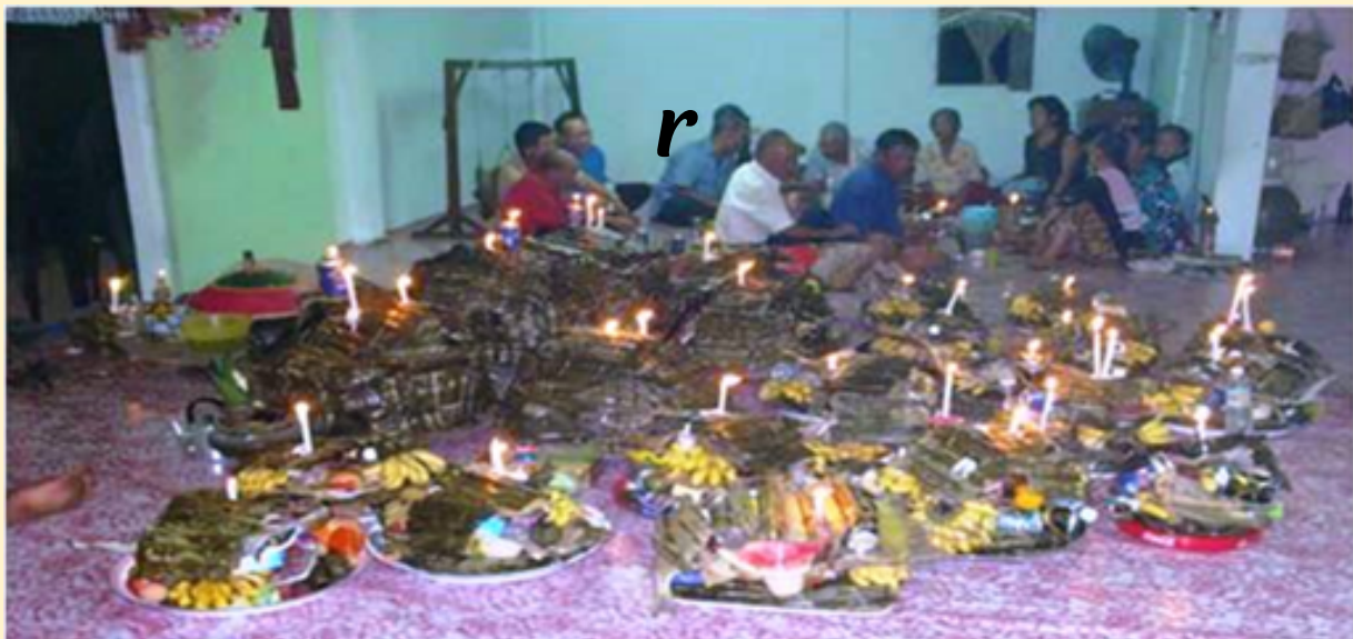
Hidangan bagi upacara 'Moginum' yang akan dihidangkan selama satu malam.

Moginum diadakan dalam beberapa acara iaitu Moginum Kahwin (sempena perkahwinan anak perempuan sama ada sulung atau bongsu), Moginum Kaul (mengubati orang sakit Sinimponongon atau keteguran roh nenek moyang) dan Moginum Loyob (memperingati roh seseorang yang telah meninggal dunia). Ritual ini akan diadakan selama dua hari bermula pada hari pertama yang dipanggil bomasak iaitu proses penyediaan pelbagai jenis makanan untuk dihidangkan terutama kolupis (beras pulut yang dimasak dengan santan) dalam kuantiti yang banyak.