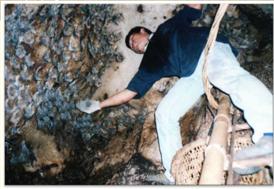
Kegiatan mengutip sarang burung di dalam gua