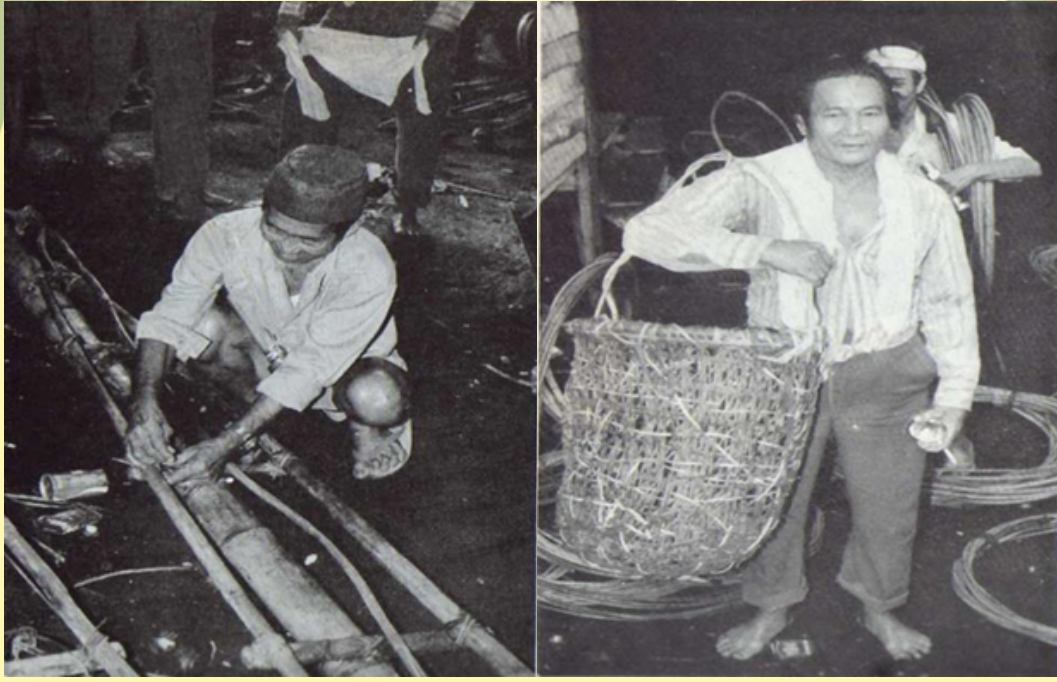
Kegiatan mengutip sarang burung