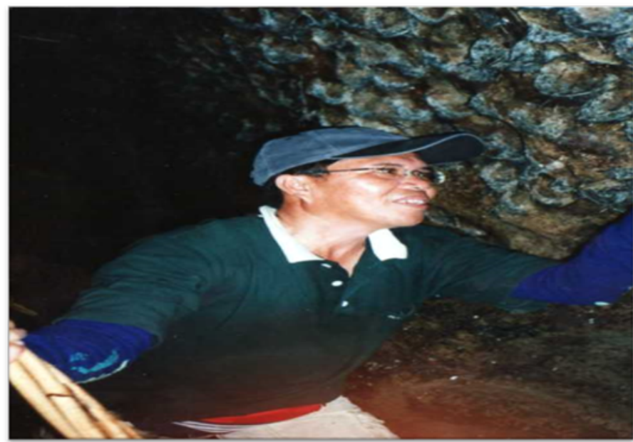
Seorang pengutip sarang burung yang mahir menjalankan kerja-kerja semasa aktiviti mengutip sarang burung