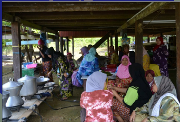
Kemiti dan kaum wanita dalam aktiviti menulung