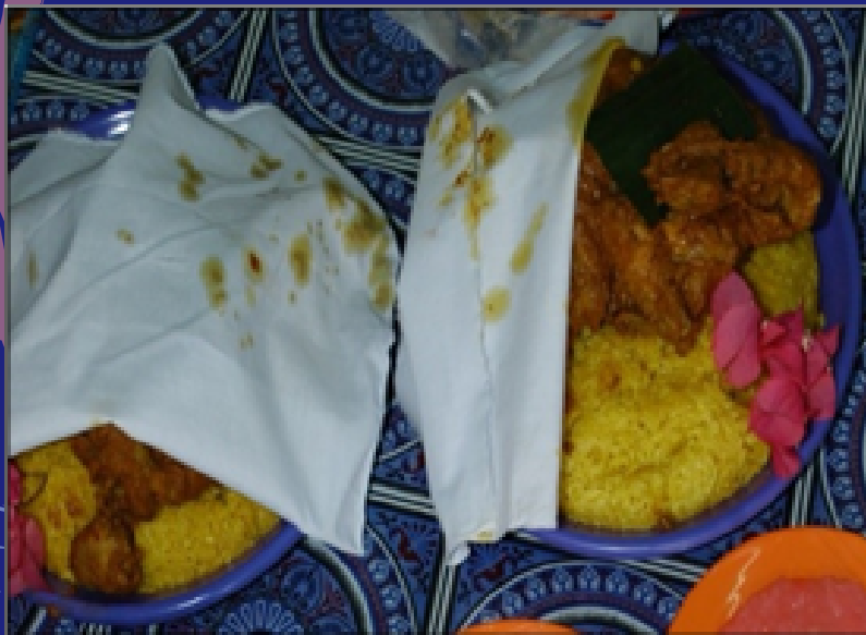
Rasol semasa kondangan

Nasi tumpang di Jawa mempunyai perbezaan mengikut acara yang diraikan tetapi bagi etnik Cocos, mereka menyediakan nasi tumpang atau rasol secara seragam iaitu nasi kuning diletakkan di atas pinggan atau tampak berbentuk gunung dan di atasnya diletakkan seekor ayam panggang. Tuan rumah akan berniat melalui nasi tumpang berkenaan dan segala doa yang perlu akan dibacakan oleh imam.