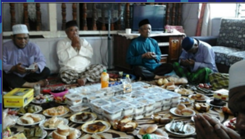
Berkat nasi begana

Berkat nasi begana mempunyai maksud yang hampir sama dengan berkat pulut kuning atau rasol, bezanya berkat nasi begana mempunyai skala yang lebih kecil berbanding rasol. Berkat nasi begana biasanya dihidang semasa kenduri guntingan atau setaraf dengannya. Ia juga boleh dianggap sebagai kenduri yang dibuat oleh orang yang kurang berkemampuan sekiranya tidak berkemampuan menyediakan rasol sebagai sedekah. Makanan lain yang disebut sebagai tek-tekan turut disedekahkan bagi mengingati arwah si mati mengikut makanan kesukaannya. Kesemua makanan tersebut dibahagikan kepada semua jemaah yang datang sebagai sedekah.