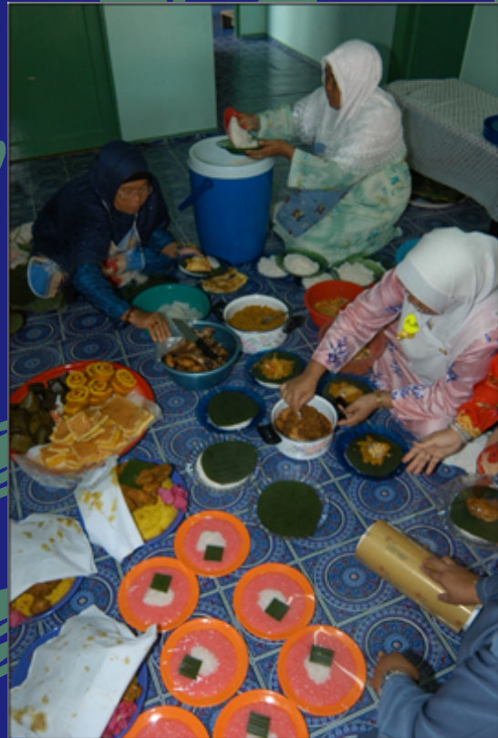
Menulung (bergotong-royong) menyiapkan sajen