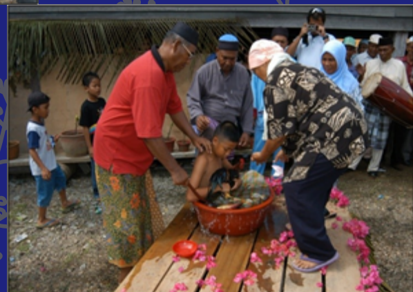
Peluk ayam jantan dalam upacara mandi bunga anak sunatan