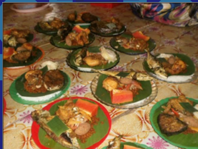
Berkat nasi begana