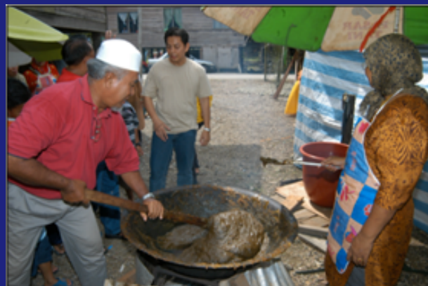
Membuat dodol salah satu aktiviti menulung