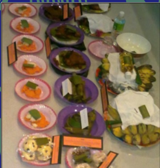
Sajen yang telah disediakan