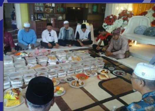
Juadah semasa kondangan