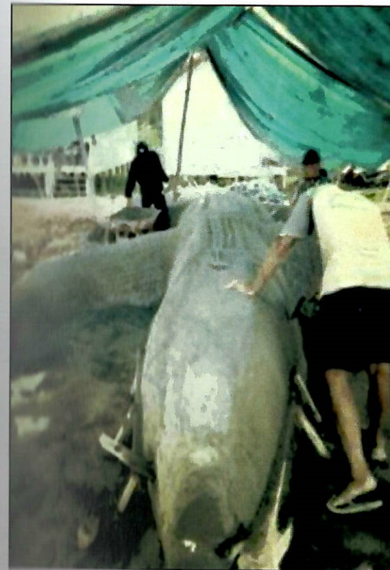
Replika ulung buayo

binatang yang boleh hidup dalam dua alam iaitu di darat dan sungai. Menurut kepercayaan etnik Murut Kolor ulung buayo diumpamakan sebagai musuh. Semasa majlis agulung rah buayo berlangsung mereka yang berjaya pulang dengan membawa kejayaan dalam peperangan akan menunjukkan kekuatan mereka dengan menetak belakang replika buaya tersebut, sambil menjerit melaungkan nama mereka dengan sekuat hati.