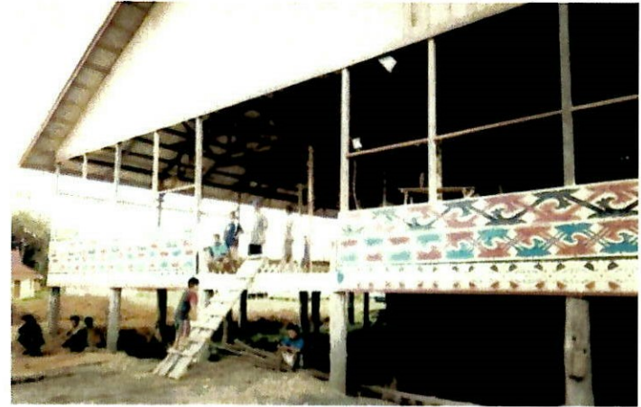
Rangka rumah tradisi etnik murut kolor

bahagian yang sangat penting bagi rumah tradisi etnik Murut Kolor. Hal ini demikian kerana, salogh merupakan ruang atau tempat tuan rumah melayan tetamu dan bersantai dengan penghuni rumah tersebut.