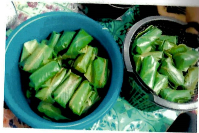
Gambar makanan linopot