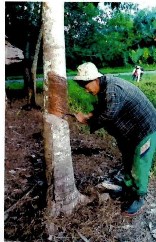
Menoreh getah merupakan salah akitiviti ekonomi etnik Murut Kolor

Aktiviti penanaman padi juga diusahakan untuk keperluan sendiri sahaja. Selain daripada padi, ubi kayu juga merupakan sumber makanan utama etnik Murut Kolor. Makanan yang dihasilkan daripada ubi kayu dikenali sebagai eluae/lahi (sagu) dalam bahasa Murut Kolor. Penanaman ubi kayu masih giat dijalankan sehingga kini untuk menampung sumber makanan dan menjana pendapatan sampingan mereka.