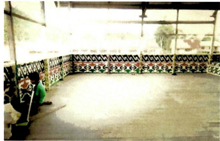
Hiasan motif yang terdapat di rumah tradisi etnik Murut Kolor