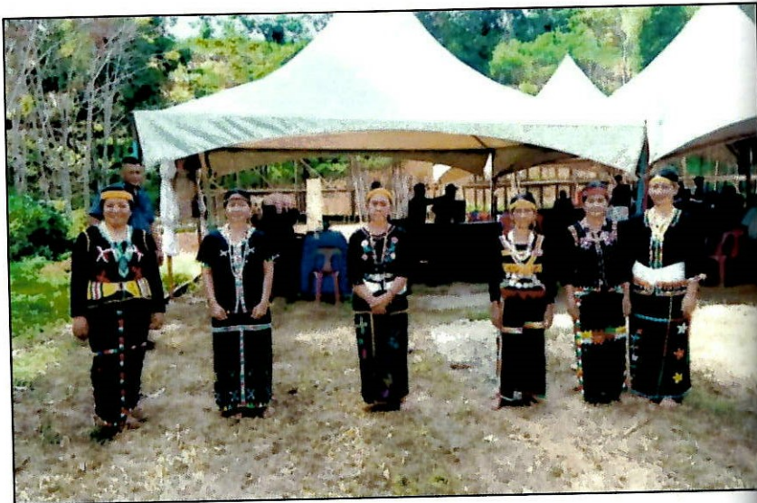
Gambar penari etnik Murut Kolor

Muzik dan tarian tradisional merupakan salah satu komponen budaya yang menjadi identiti bagi sesuatu etnik. Bab ini akan menjelaskan muzik dan tarian tradisional etnik Murut Kolor.