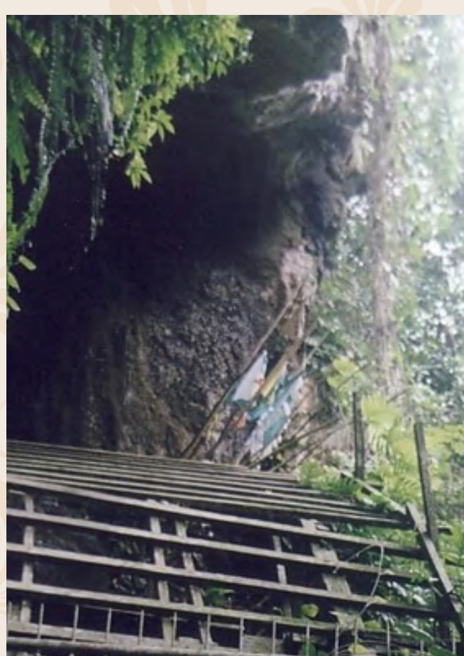
Kawasan persekitaran dari luar di Agob Batu Balos. Tangga tersebut digunakan sebagai jalan untuk masuk ke dalam gua

Tempat meletakkan lungun juga dibuat atap untuk mengelakkan lungun dibasahi hujan. Di bawah tempat lungun diletakkan, tanah akan dikorek untuk membuat lubang agar rina'at (cecair) si mati yang mereput masuk ke dalam lubang tersebut. Penduduk kampung terutamanya kaum lelaki bergilir-gilir untuk menjaga lungun pada waktu siang dan malam.