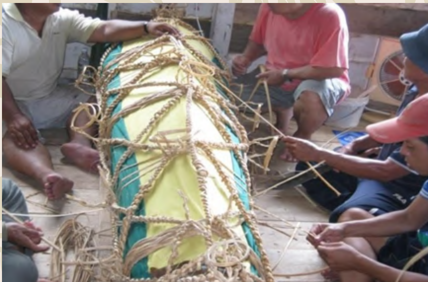
Proses mengikat lungun yang juga dipanggil sebagai mangaggiraut

Menjelang subuh di hari pengebumian, sindul perlu dimasak untuk dihidangkan kepada semua orang. Selepas itu makanan untuk orang ramai juga dimasak sebelum upacara pengebumian. Pada hari tersebut juga, lungun perlu diikat dengan rotan oleh golongan lelaki yang mahir mengenai kerja-kerja berkenaan. Kerja-kerja yang dikenali sebagai mangaggiraut tersebut mengambil masa yang agak lama untuk menyiapkannya kerana perlu dilakukan dengan teliti. Lungun yang telah siap diikat akan ditutup dengan kain marong (kain kapas) yang dipanggil sebagai sandakop. Penggunaan warna kain sandakop mempunyai maksud yang tersendiri, kain berwarna merah hijau adalah untuk lelaki dan kuning hijau untuk wanita. Manakala kain berwarna hitam putih pula digunakan sekiranya si mati beragama Kristian.