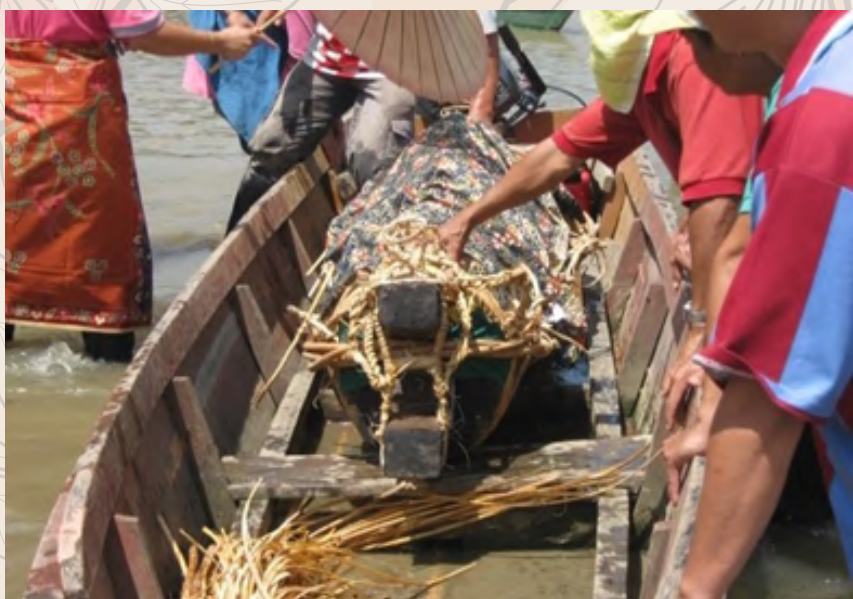
Lungun dimuatkan ke dalam alud untuk dibawa ke kawasan perkuburan

Perjalanan ke tempat pengebumian etnik Dusun Subpan terutamanya di agob (gua) Batu Balos hendaklah menggunakan alud (perahu). Pada masa dahulu etnik Dusun Subpan terpaksa gumauh (mendayung) alud untuk membawa lungun sehinggalah ke tunon (pengkalan). Penduduk kampung yang sampai lebih awal di tunon akan menempiaskan air sungai ke arah alud yang membawa lungun si mati untuk menghalau roh-roh orang mati yang berada di atas lungun. Menurut kepercayaan mereka, semasa pengebumian roh-roh orang yang telah lama meninggal dunia akan duduk di atas lungun yang menyebabkan lungun menjadi sangat berat apabila diangkat.