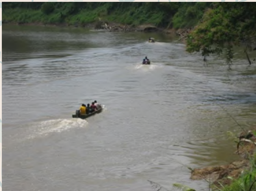
Perjalanan menuju ke tempat pengebumian yang perlu mengharungi sungai

Apabila sampai di kawasan perkuburan bendera-bendera yang mengiringi jenazah kemudian dipacak di tepi jalan yang menuju ke gua. Tujuan membawa bendera semasa kematian adalah sebagai tanda penghormatan kepada si mati. Kemudian lungun diusung ke kaki gua dan diletakkan sekali lagi ke tanah sebelum ditarik dengan tali. Pada masa dahulu proses menaikkan lungun di atas gua adalah dengan menggunakan rotan. Menurut kepercayaan etnik Dusun Subpan sekiranya lungun terjatuh semasa kerja-kerja menaikkan di atas gua, maka lungun tersebut tidak boleh diangkat semula. Sekiranya terdapat penduduk terjatuh semasa naik ke atas gua lalu meninggal dunia, maka mayatnya tidak boleh dibawa balik ke rumah tetapi hanya dibiarkan sahaja di tempat tersebut.