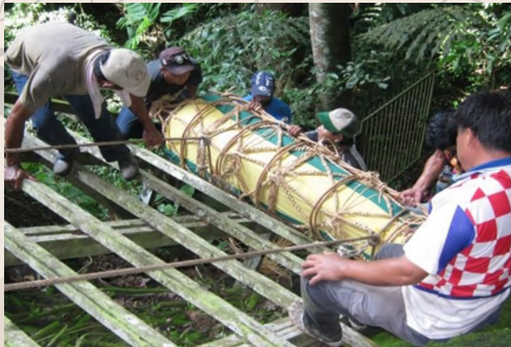
Kerja-kerja menaikkan lungun ke atas gua menggunakan rotan