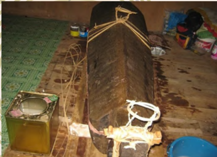
Jenazah telah dimasukkan ke dalam lungun selepas upacara manutub/mangarantop'

Dipercayai penyakit tersebut boleh menyebabkan kematian jika tidak dapat dirawat. Selepas itu, ahli keluarga bergilir-gilir untuk mencium dahi, tangan dan kaki jenazah sementara tetamu yang hadir melihat jenazah untuk kali yang terakhir. Setelah itu lungun ditutup dan diikat dengan rotan kemudian diletakkan di atas dua potongan kayu yang dikenali sebagai dadangol.