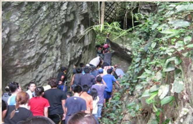
Saudara mara dan orang kampung yang turut serta membantu keluarga si mati semasa pengebumian di Gua Batu Balos

(menyebut nama anak), mangawat koh ganut.