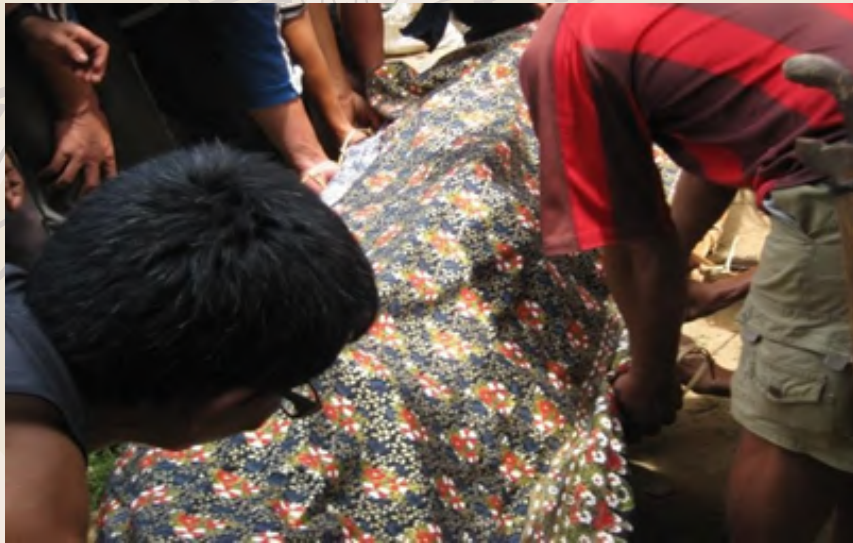
Lungun yang telah ditutup dengan kain batik

Perjalanan ke tempat pengebumian etnik Dusun Subpan terutamanya di agob (gua) Batu Balos hendaklah menggunakan alud (perahu). Pada masa dahulu etnik Dusun Subpan terpaksa gumauh (mendayung) alud untuk membawa lungun sehinggalah ke tunon (pengkalan). Penduduk kampung yang sampai lebih awal di tunon akan menempiaskan air sungai ke arah alud yang membawa lungun si mati untuk menghalau roh-roh orang mati yang berada di atas lungun. Menurut kepercayaan mereka, semasa pengebumian roh-roh orang yang telah lama meninggal dunia akan duduk di atas lungun yang menyebabkan lungun menjadi sangat berat apabila diangkat.