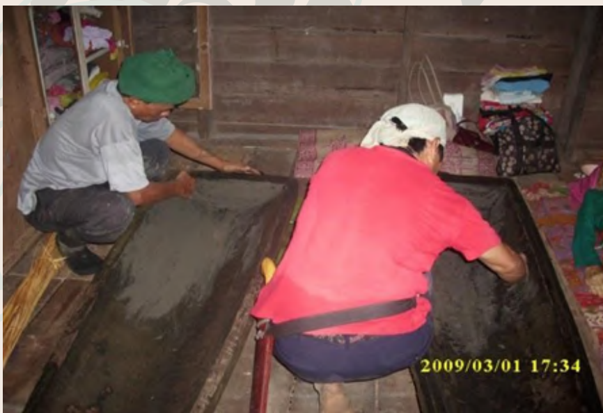
Menyapu butak (tanah liat) di permukaan dalam lungun

Manutub / mangarantop adalah upacara memasukkan jenazah ke dalam lungun. Upacara tersebut hanya boleh dilakukan apabila semua anggota keluarga si mati telah berkumpul untuk memberi penghormatan dan melihat wajah si mati buat kali terakhir. Sebelum memasukkan jenazah, kedua-dua permukaan sebelah dalam lungun akan disapu dengan butak (tanah liat). Tujuannya adalah bagi menutup liang-liang urat kayu. Pada masa dahulu natong (damar) akan ditumbuk dan diadun untuk dijadikan gam yang perlu diletakkan di sekeliling tepi bawah lungun.