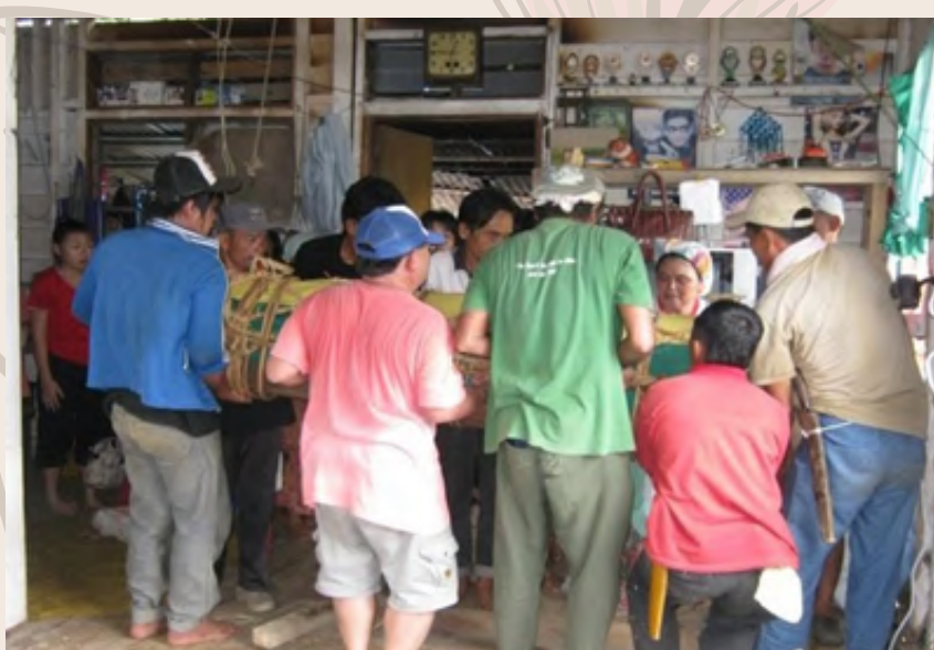
Lungun diangkat tinggi agar anak-anak si mati dapat melintas di bawahnya

Apabila tiba masa menuju ke kawasan perkuburan, basal (alat muzik tradisional) perlu dimainkan sebanyak tiga kali. Lungun kemudian diangkat untuk membolehkan anak-anak si mati dapat melintas di bawah lungun secara pergi dan balik. Amalan tersebut diamalkan kerana dipercayai bahawa anak-anak si mati yang masih hidup akan menghantar si mati pergi tetapi mereka yang hidup harus segera balik.