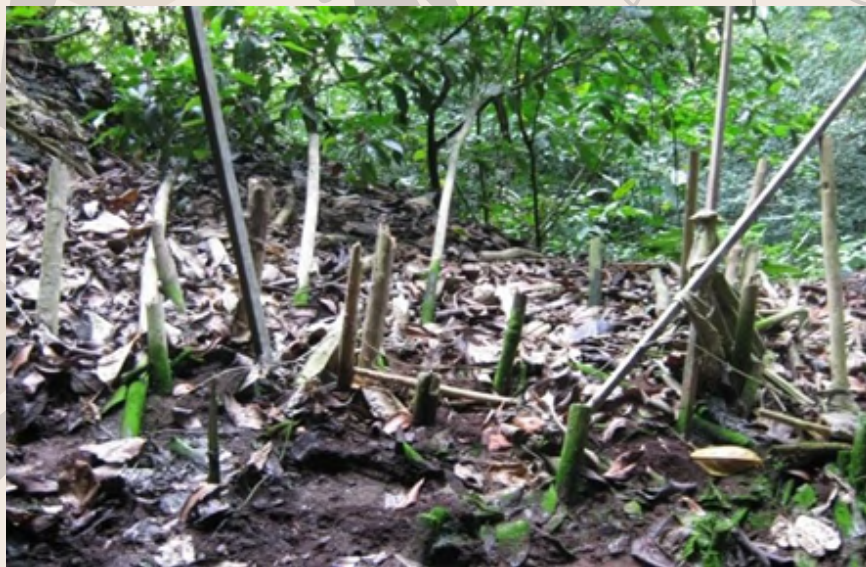
Tunggul kayu tersebut adalah bekas tiang-tiang bendera yang terdapat di kawasan Agob Batu Balos