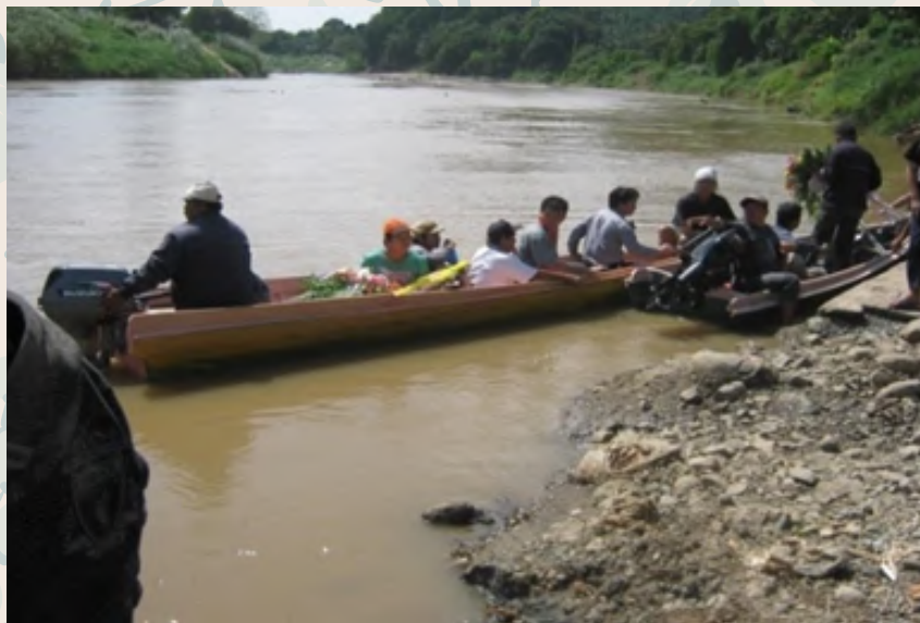
Pada masa kini penduduk kampung menggunakan alud yang dilengkapi dengan enjin untuk membawa lungun ke tempat perkuburan