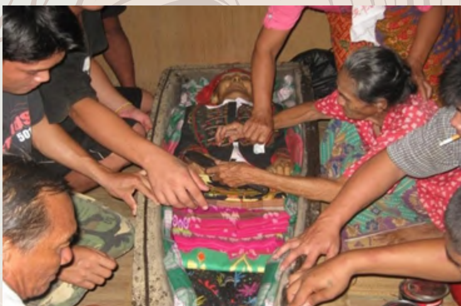
Kelihatan seorang balu mengikis kuku tangan dan kaki si mati

Setelah selesai upacara mengikis kuku jenazah, kain yang mengikat tangan dan kaki jenazah akan dibuka dan dipintal. Kain tersebut yang dikenali sebagai u'unut kemudiannya dibakar untuk mendapatkan asapnya dan dihayun dari kepala ke hujung kaki lebih kurang sebanyak tiga (3) kali. Amalan tersebut dibuat agar atod (semangat) orang hidup dan roh jahat tidak akan termasuk ke dalam lungun. Selepas itu, upacara menutup lungun akan dilakukan.