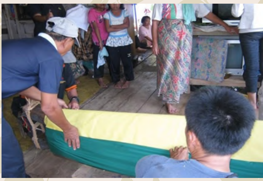
Menutup lungun dengan kain Sandakop