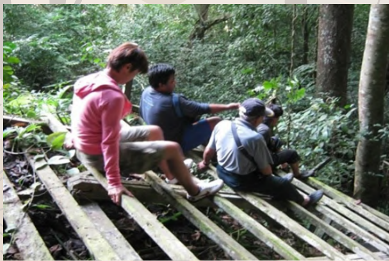
Cara-cara menuruni tangga tukad abai yang terdapat di Agob Batu Balos