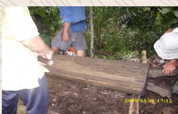
Pembuat lungun sedang memadankan pasangan keranda

Lungun yang dikebumikan di dalam Gua Batu Balos sejak sekian lama. Sehingga ke hari ini gua tersebut masih digunakan sebagai tempat pengebumian oleh sesetengah etnik Dusun Subpan yang beragama Kristian dan Pagan. Ukiran pada lungun dan pandung (hujung keranda) tersebut menandakan si mati adalah daripada golongan yang terhormat dan berpangkat dalam masyarakat.