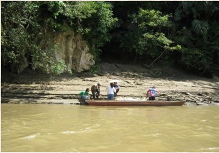
Alud (perahu) merupakan salah satu pengangkutan yang penting untuk mengangkat lungun khususnya di kawasan Batu Balos yang terletak di pinggir Sungai Segama.

Pada keesokan harinya dipanggil karatob manilaa. Menurut kepercayaan etnik Dusun Subpan, pada malam tersebut penjaga roh si mati akan datang untuk menjilat bekas tempat meletakkan lungun. Menurut bomoh atau orang-orang tua yang dapat melihat roh orang mati, penjaga roh si mati dikatakan mempunyai lidah yang panjang untuk menjilat dan membersihkan tempat tersebut. Penjaga roh si mati dikenali sebagai Langgau Dilla.