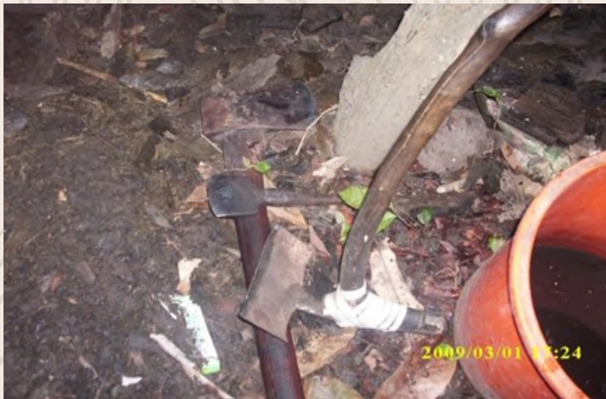
Peralatan-peralatan yang digunakan untuk membuat lungun