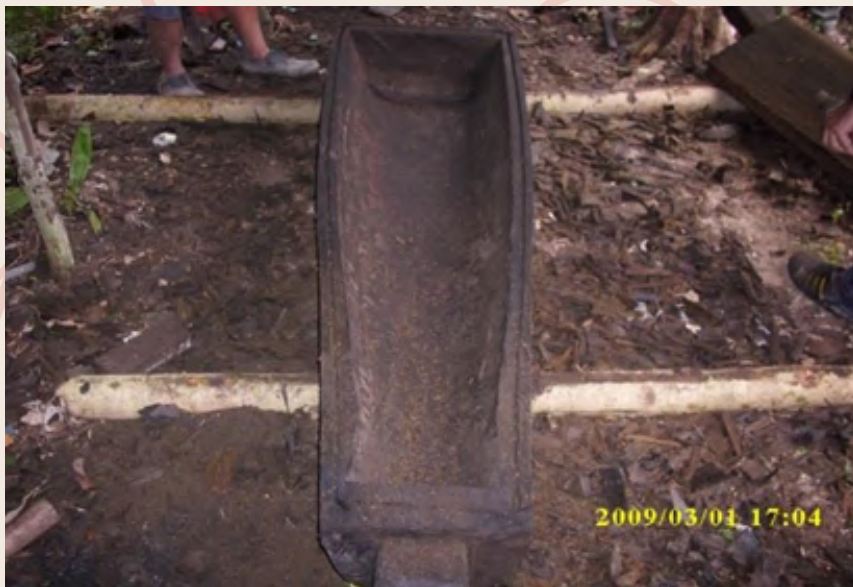
Gambar penuh sebuah lungun

Etnik Dusun Subpan sangat mementingkan kerjasama dalam melakukan sesuatu perkara. Sekiranya berlaku kematian penduduk kampung yang mempunyai kemahiran membuat lungun saling berkerjasama untuk menyiapkan sebuah lungun untuk si mati.